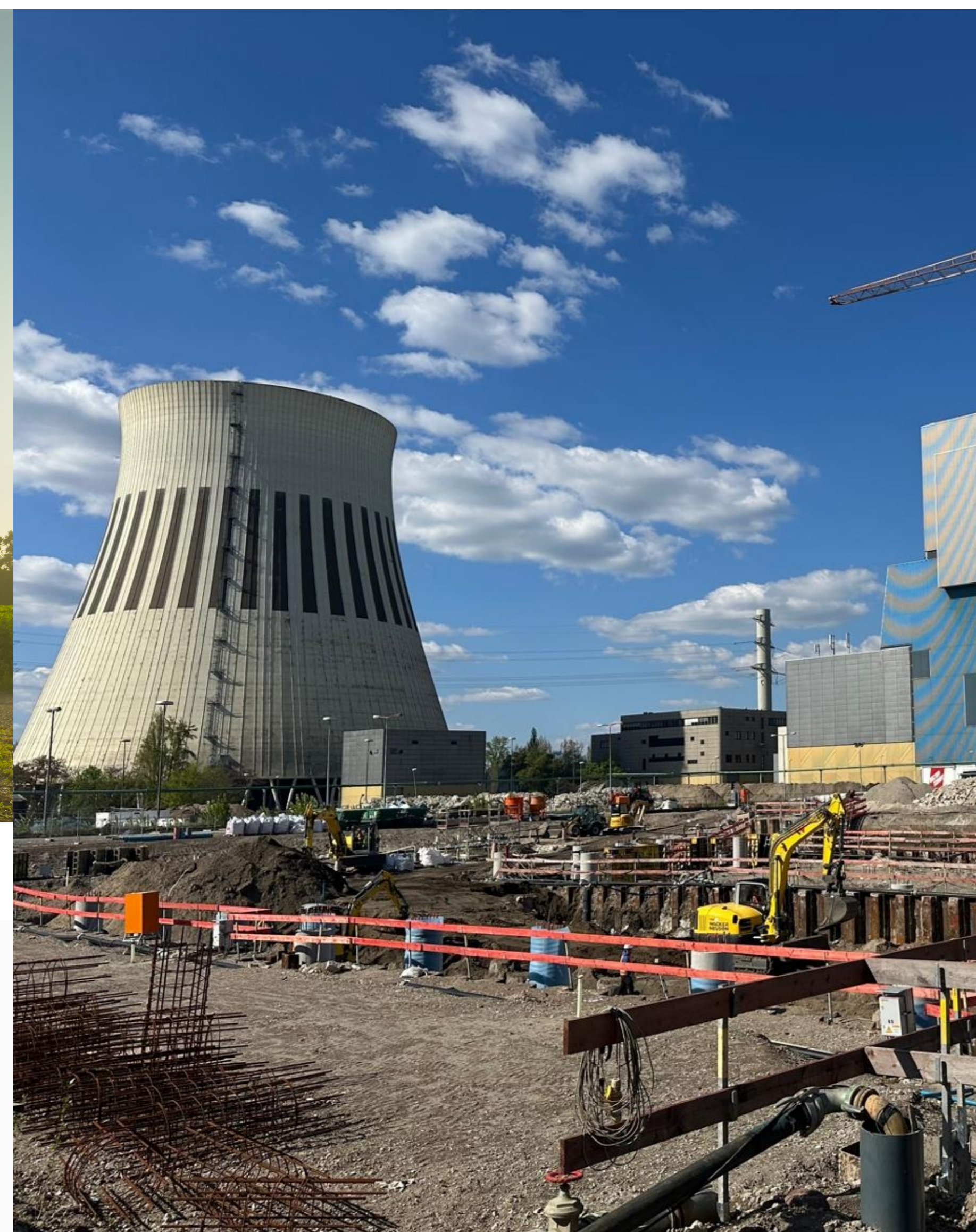
General- unternehmer & EPC