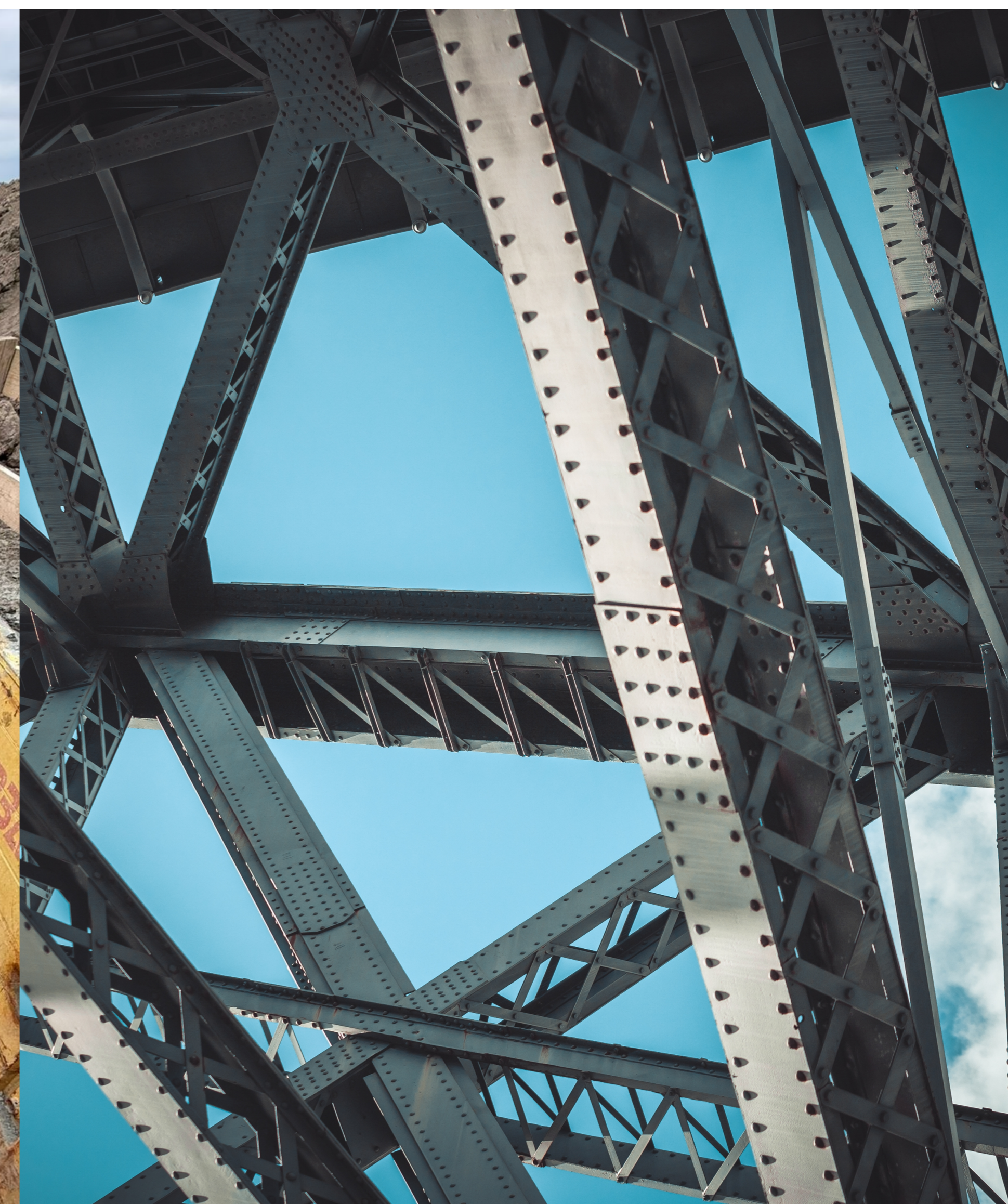
Stahlbau & Industriebau