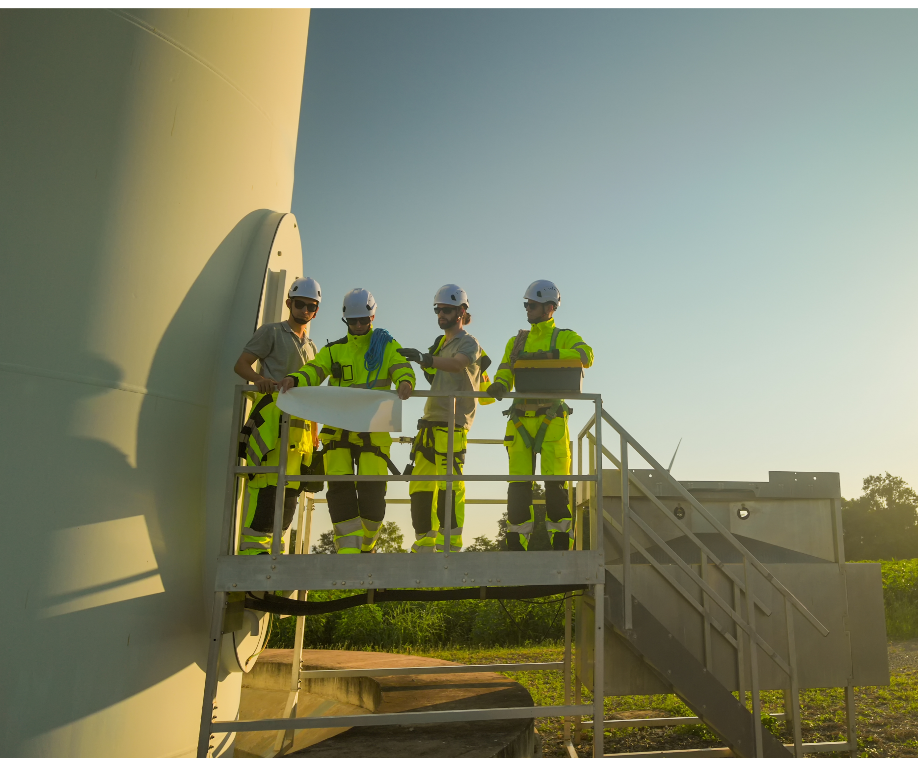
Planung & Engineering