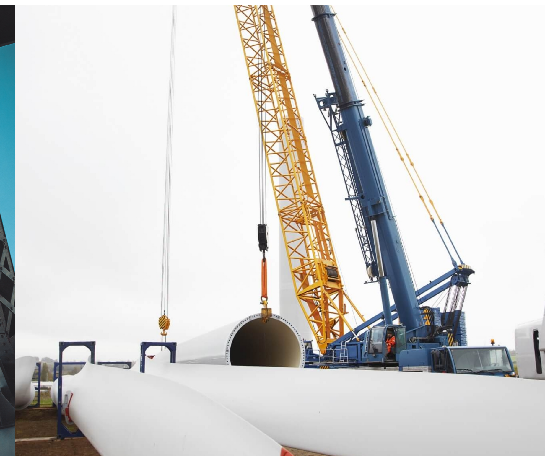
Energie- anlagen & Infrastruktur